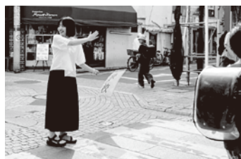
ある店員さんの相談「小学生たちの安全を守る旗を振りたい!」

商店街は、安心して温かいつながりがあり、つくりたい暮らしを叶えられる場でありたい。広報のカタチも、より店主さんの顔が見えるものに、また、尾山台での毎日が心豊かなものになるようにと試行錯誤しています。そのひとつが商店街Instagramのバージョンアップです。個性豊かなお店の情報に加え、まちの風景やイベント情報など尾山台の楽しみ方を紹介していますので、ぜひフォローしてみてください!(QRコードを表面に載せています)